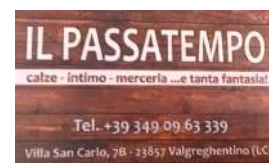
VILLA SAN CARLO