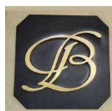
GIOELLERIA BASSANI OLGINATE